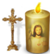
Danke für die vielen Messfeiern in der Thaurer Lorettokirche