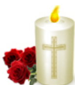
Du bist immer in