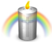
Ruhe in Frieden Manni aus Hatting