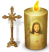
fam jenewein taxerhof