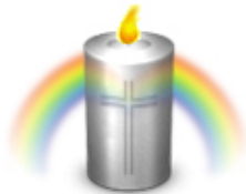
Taxi Martin Team