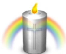
A Lichtl aus